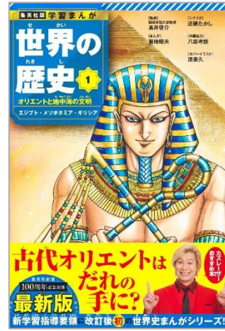
「集英社版 学習まんが 世界の歴史」全18巻

まず題名で「え!？」と思いますよね。酒が主食ってありえないでしょ?と思いきや、作者はノンフィクションで有名な高野秀幸氏。これは読んでみるしかないでしょう!お酒好きな大人におすすめ。